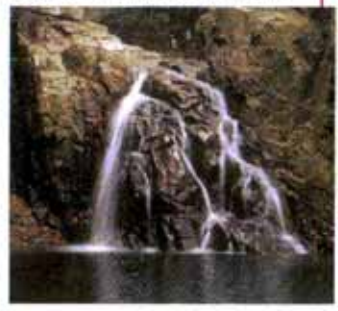
千手滝 (赤目五瀑) 高さ15m、幅4m。複雑な形の岩をすべり落ちる美しい姿から名付けられました