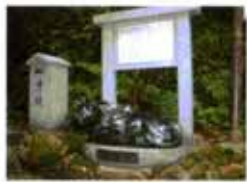
赤目牛 不動明王が乗って現れたと言う伝説の赤い目の牛