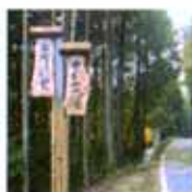
この看板が見えたら赤目 四十八滝まであと3kmです