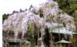
延寿院の桜 日本不動三休仏の一つを安置する延寿院。境内のしだれ桜は、樹齢300年を越すと言われています