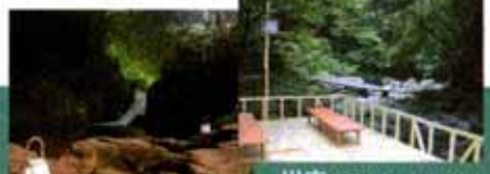
滝のライトアップ (7月中旬～8月下旬) 川床 (7月中旬～8月下旬) 霊蛇滝及び不動滝周辺