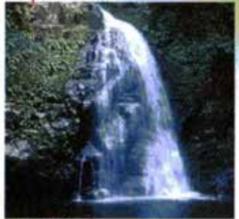
不動滝 (赤目五瀑) 高さ15m、幅7mの名瀑。不動明王にちなんで名付けられたもの。"滝参り"とはこの滝に参ることを意味し、明治の中ごろまではここから奥へは入れなかったそうです