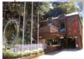
日本サンショウウオセンター