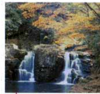
荷担滝 (赤目五瀑) 高さ8m、ふたつに分かれて流れ落ちるさまから名付けられたもの。個性的な姿が人気で赤目四十八滝のシンボリック的存在