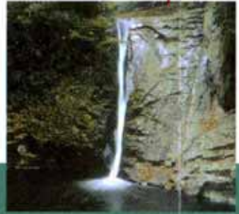
布曳滝 (赤目五瀑) 高さ30m。名の通り白布を長々とたらしただような優美な姿の滝。水が掘り込んだ滝壺の深さは何と30m!