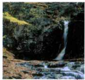
琵琶滝 (赤目五瀑) 高さ15m。楽器の琵琶に似ていることからこの名に。滝壺の神秘的な色もお見逃しなく