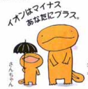
さんちゃん タンキィ